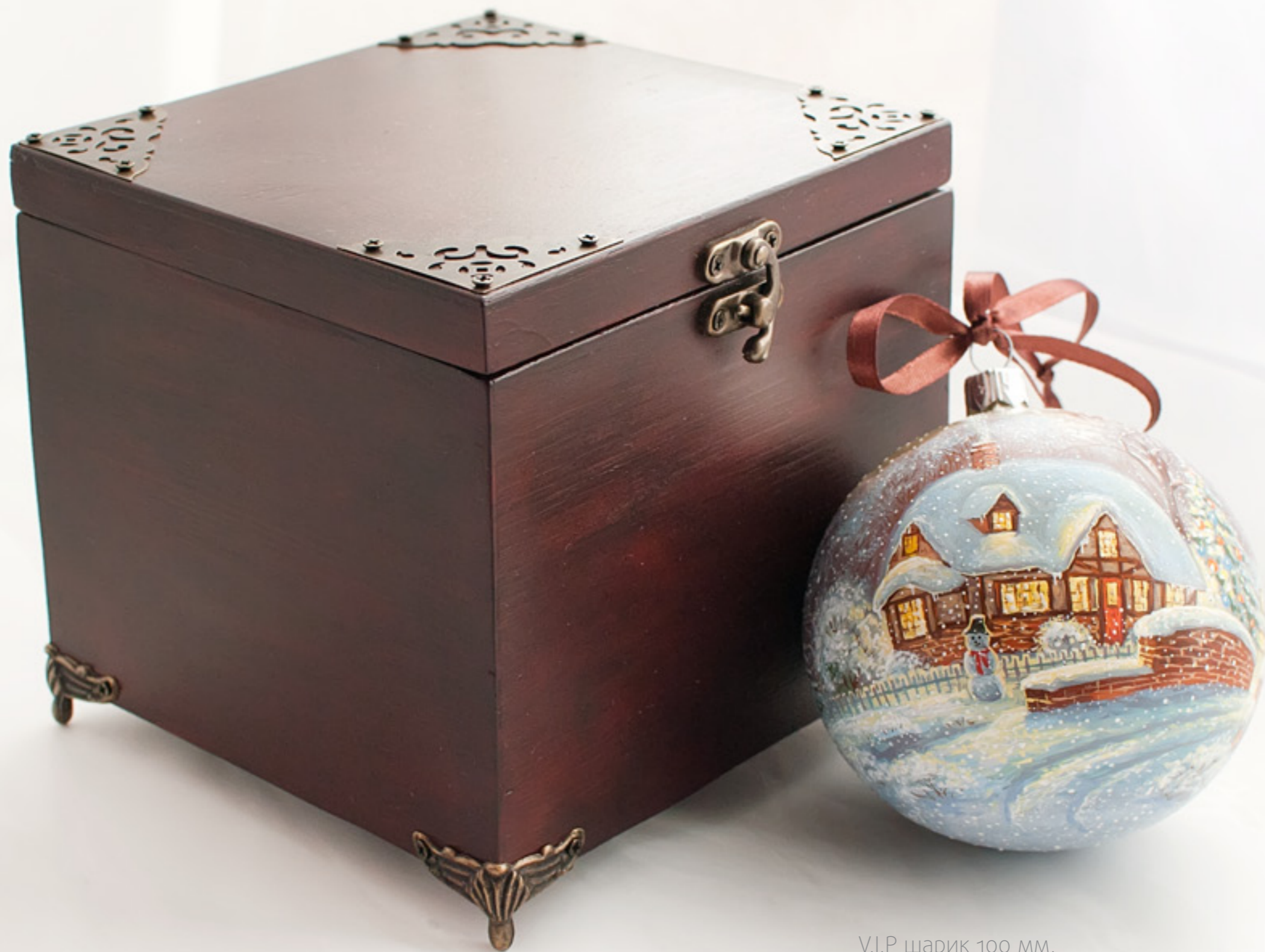
VI.P шарик 100 мм. Художественная роспись с изображением рождественского европейского пейзажа.