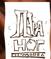
VI.P игрушки – бутылочки