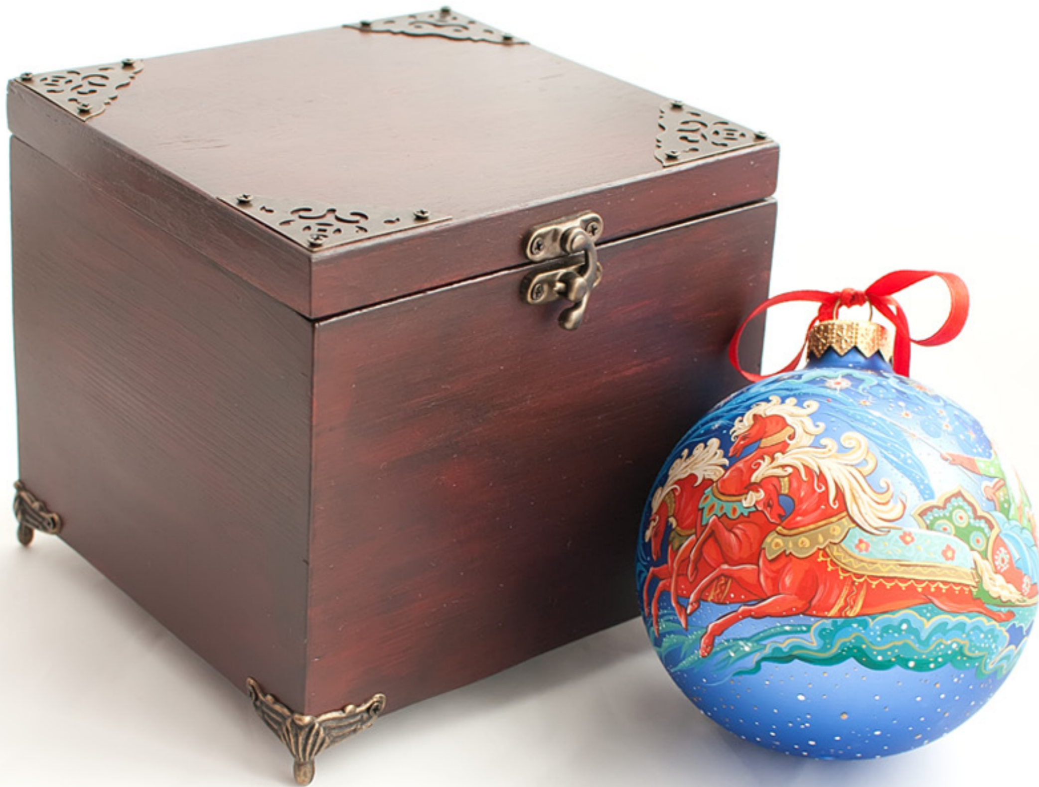
VI.P шарик 100 мм. Художественная роспись с изображением русского зимнего мотива.